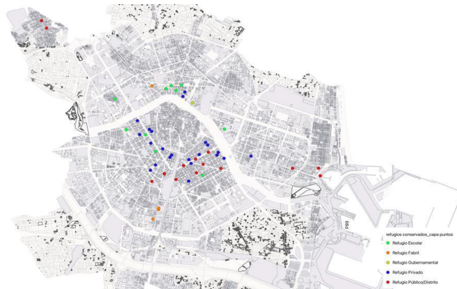
Refugios recogidos en la propuesta de catalogación

Sin embargo, a pesar de incluir en el listado los 9 elementos ya protegidos en el Catálogo Estructural de Bienes y Espacios protegidos de Naturaleza Urbana, no se ha elaborado la ficha correspondiente, en tanto que se estima que cuentan