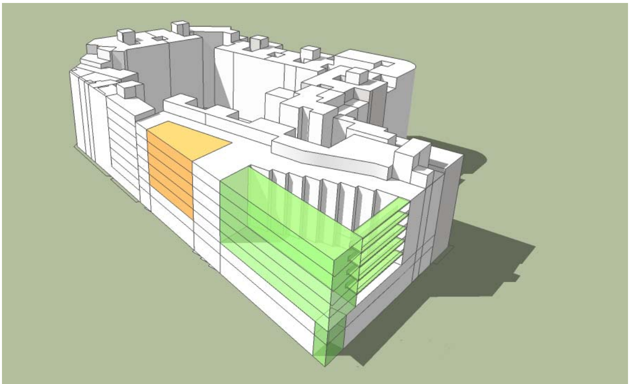
Volumetría S/ MODIFICACIÓN PROPUESTA (no vinculante), Conforme a edificabilidad disponible en ZONA 1