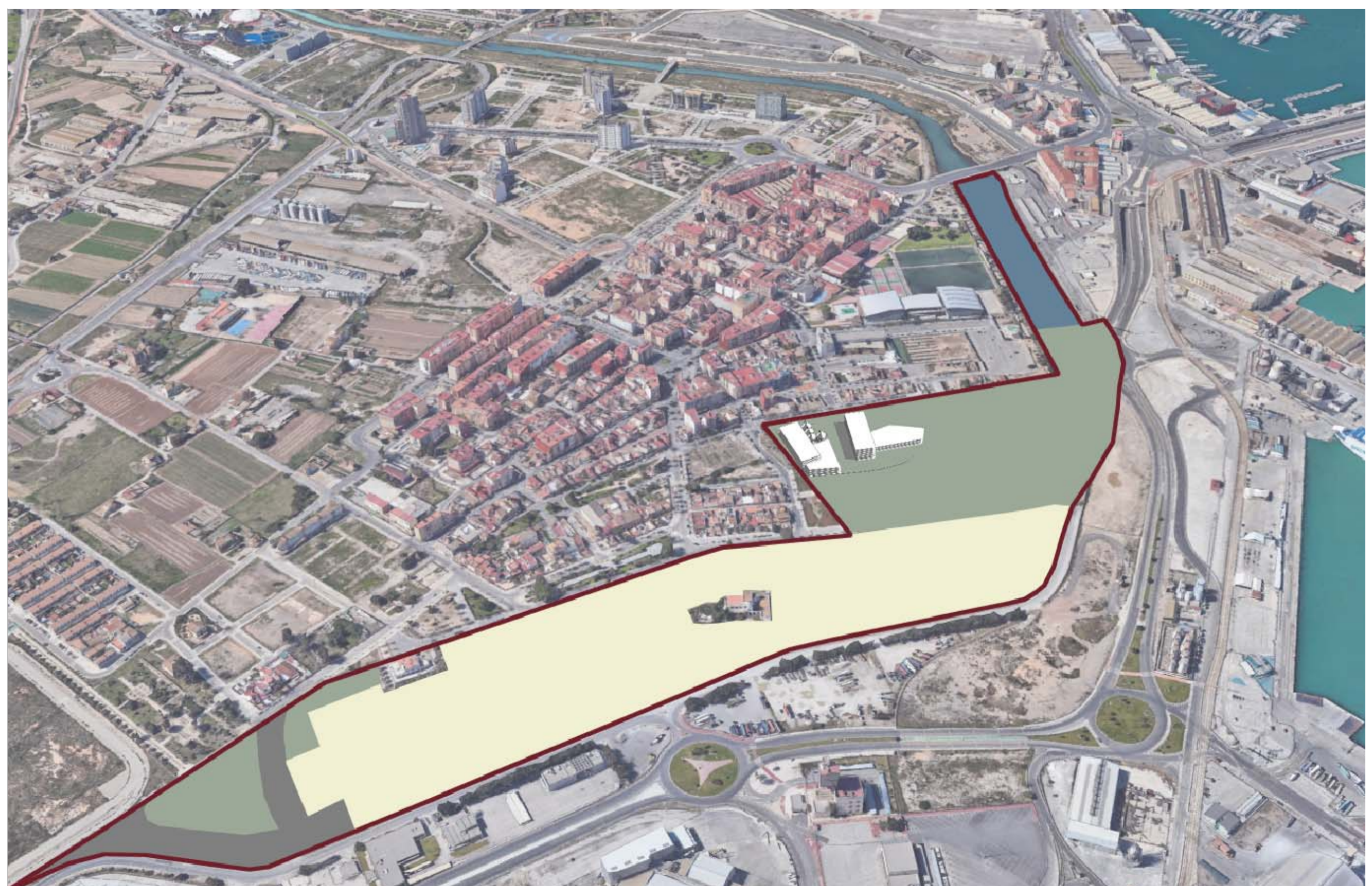
V01. VISTA DE LAS AÉREA DEL CONJUNTO

El presente documento es copia de su original del que son titulares los señores Ilustres. Su utilización total o parcial, así como cualquier reproducción o traslado a terceros, requiere la previa autorización expresa de su autor o autores quedando en todo caso permitida cualquier modificación u alteración del mismo.