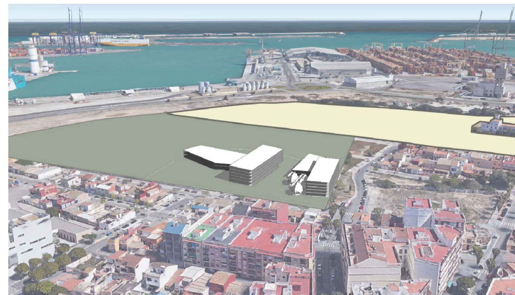
V02. VISTA DE LAS ÁREAS 1, 2 Y 3 HACIA EL AEROPUERTO