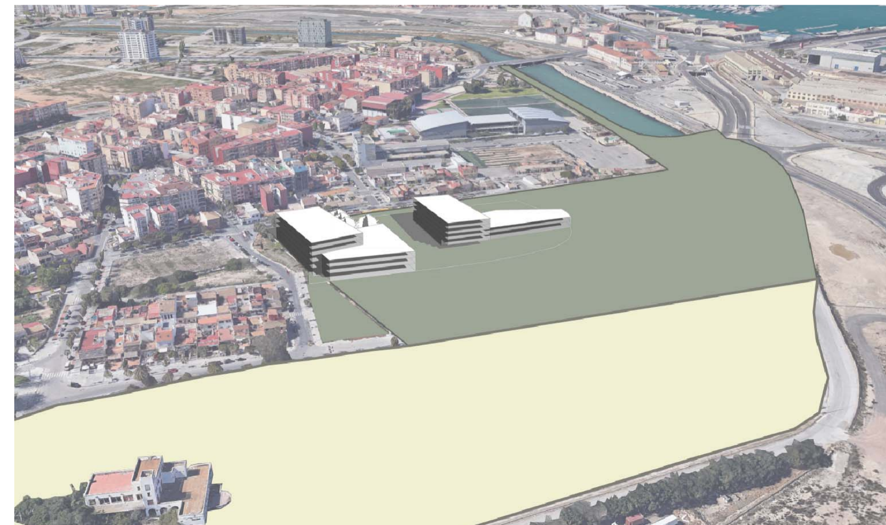
V03. VISTA DE LAS ÁREAS 1, 2 Y 3 HACIA NAZARET