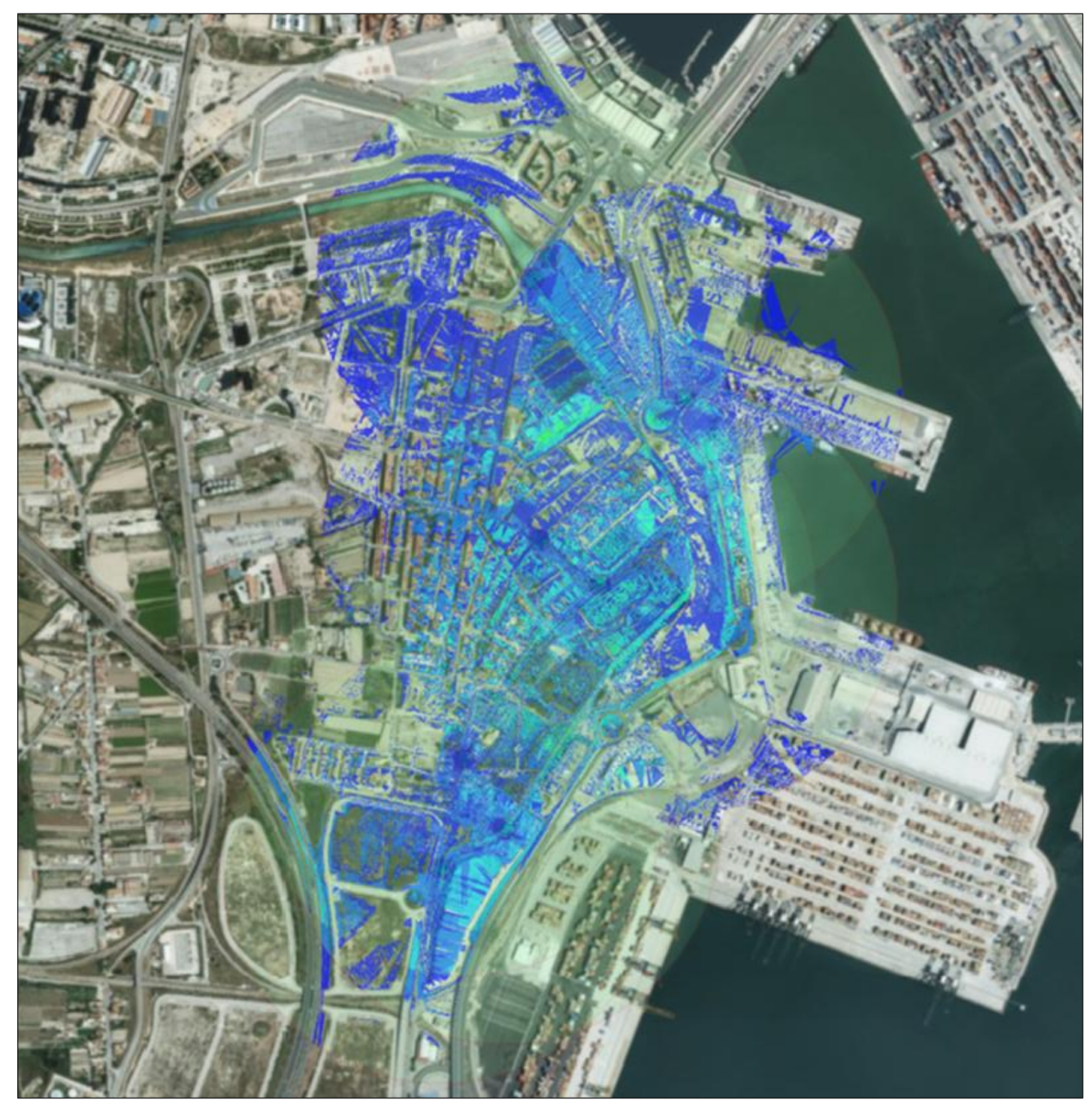
CUENCA VISUAL DEL UMBRAL DE NITIDEZ DE 0 A 500m