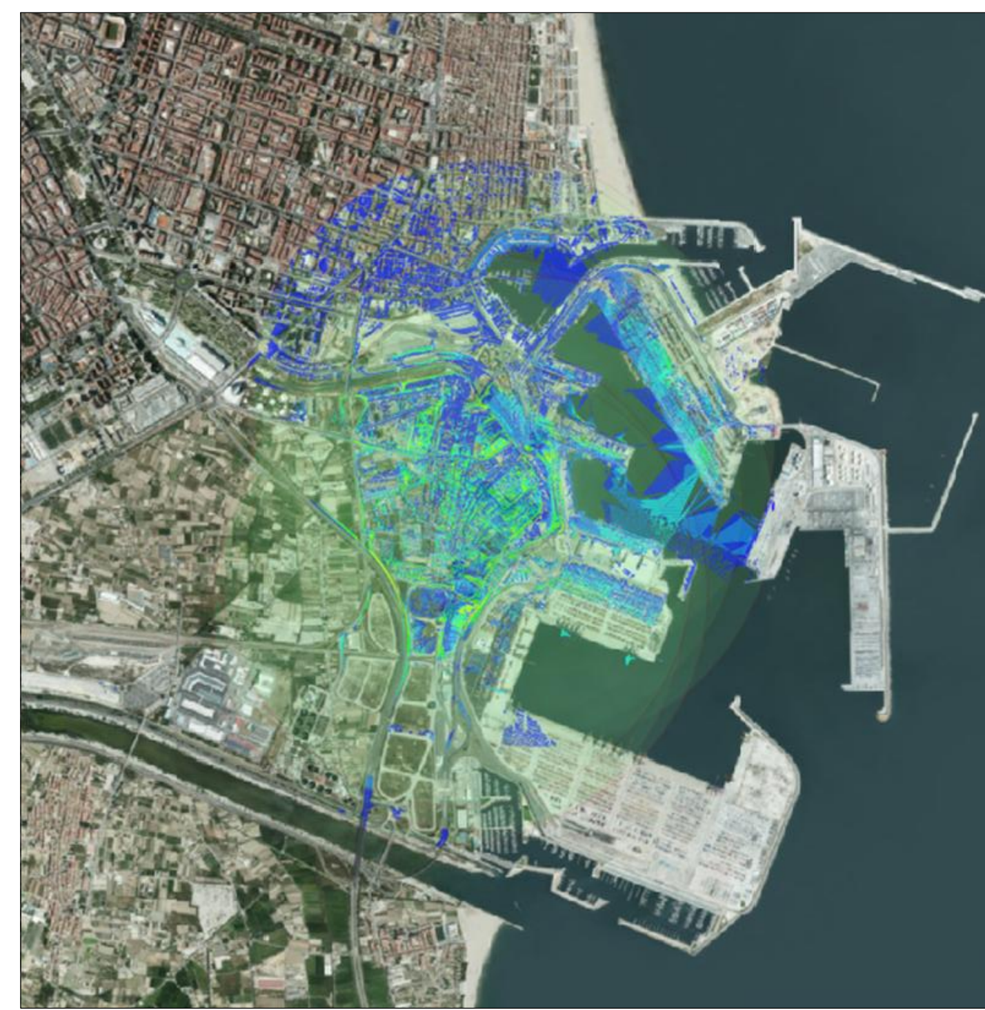
CUENCA VISUAL DEL UMBRAL DE NITIDEZ DE 500m A 1500m