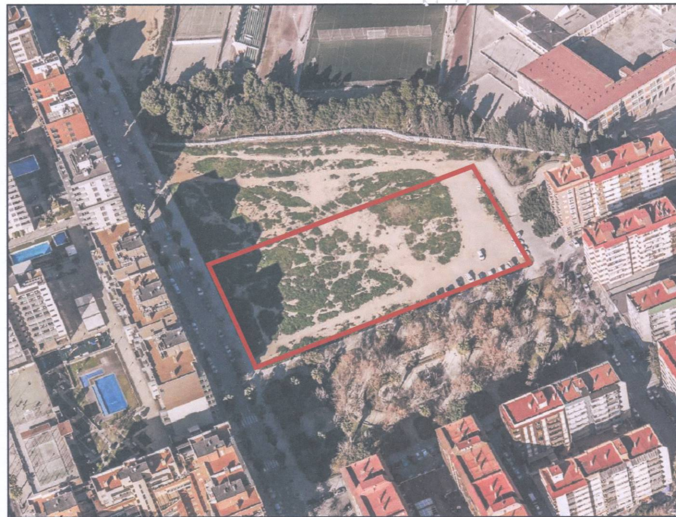
VISTA AÉREA. SITUACION S/E